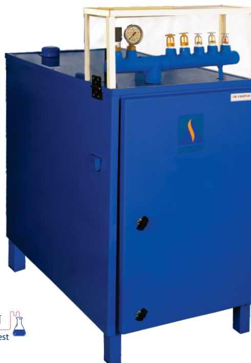
آزمون مقاومت در برابر ضربه قوچ اسپرینکلر Resistance against sprinkler water hammering test